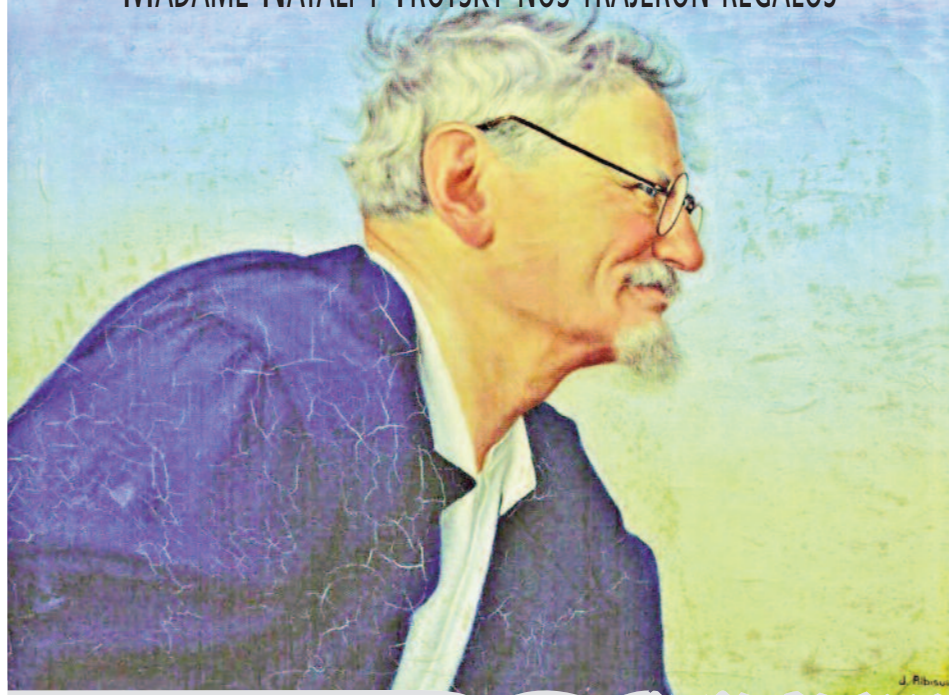
• Retrato de León Trotsky, de Josefina Albusia; tomada de http://www.elementos.buap.mx/num85/hm/61.htm

ASÍ QUE UN DÍA CUALQUIERA LLEGARON A LA CASA DE LA 3 ORIENTE, LES ABRIMOS EL ZAGUÁN PARA QUE ENTRARA EL AUTOMÓVIL Y LOS GUARDAESPALDAS SE QUEDARON AFUERA. MADAME NATALI Y TROTSKY NOS TRAJERON REGALOS