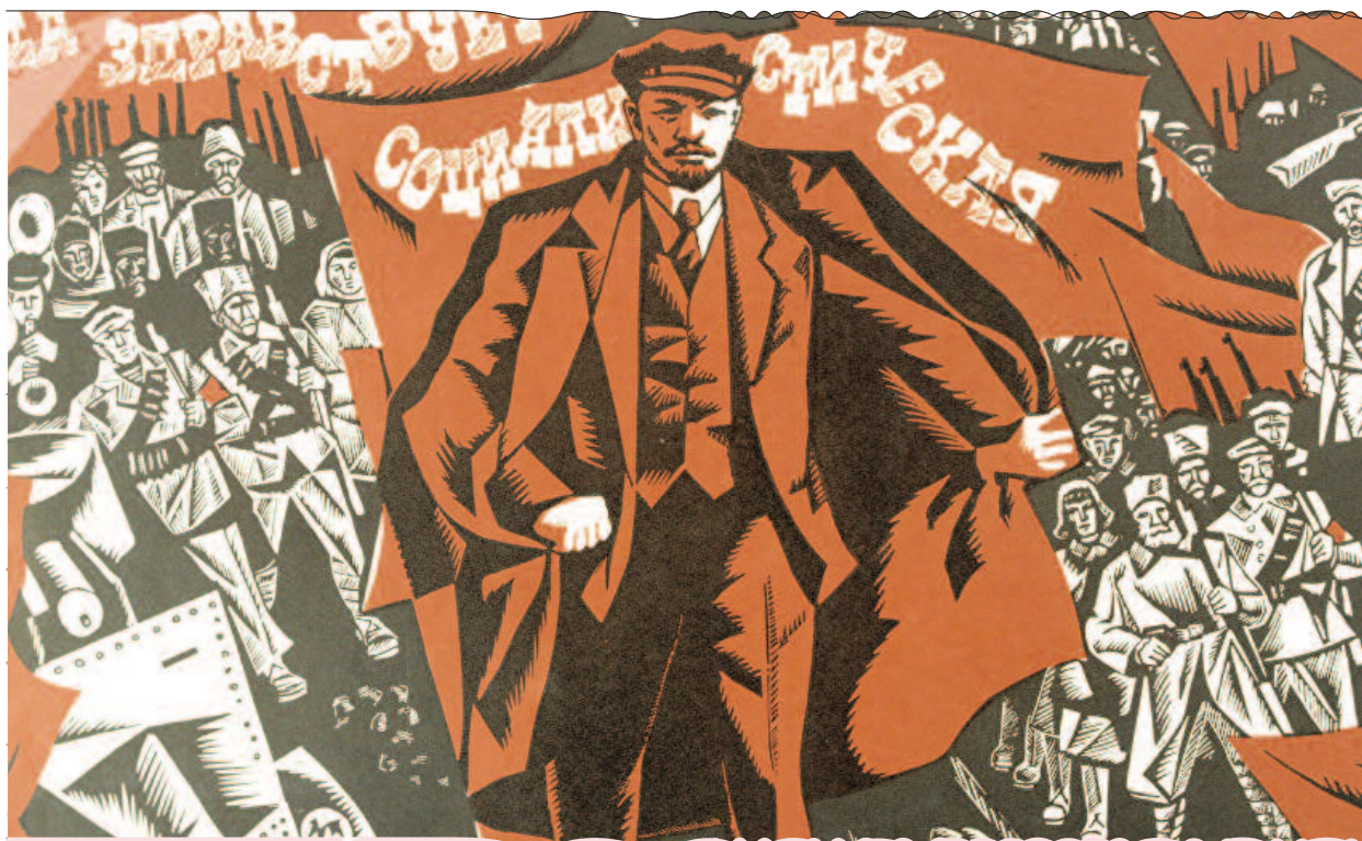
• Cartel celebrando la Revolución Rusa de 1917