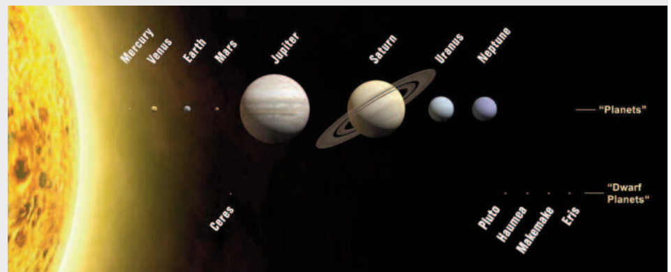
• Imagen tomada de: Edits by Pepedavila. Source image on Commons edited by Farry, credited by original uploader to "Martin Kornmesser", and later an anonymous edit re-credited it to "zaria mayers". - Edit of File:Planets2008.jpg by Farry.