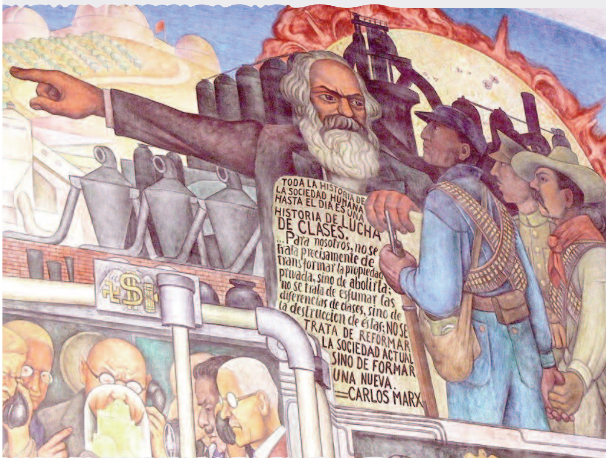
• Karl Marx en mural de Diego Rivera en el Palacio Nacional de México

proclamas ideológicas, los gobiernos comunistas nunca pudieron zafarse totalmente del sistema capitalista mundial. El conflicto es uno de los vínculos más fuertes de las redes sociales, ya sea a nivel de grupos pequeños o entre estados. Los principales estados capitalistas continuaron siendo la preocupación más importante y el punto de referencia para Moscú, Alemania, antes de 1945, y Estados Unidos a partir de entonces representaron la principal amenaza política que dictaba las prioridades de la industria y la ciencia soviéticas. No obstante, occidente también continuó siendo la fuente vital para comprar maquinaria avanzada y bienes de prestigio con los ingresos obtenidos principalmente de las exportaciones de materias primas. Las antes interminables discusiones sobre cuán genuinamente no capitalistas eran los estados comunistas concluyeron cuando, a la larga, volvieron al capitalismo.◀