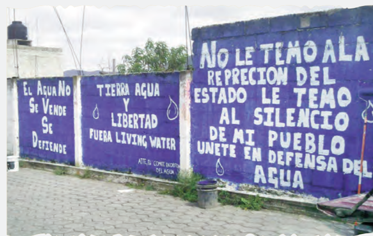
• Imagen tomada de http://tierrabaldia.com.mx/noticia/782/autoridades-de-ocotepec-y-living-water-pretenden-apropiarse-del-agua/

Las autoridades estatales y federales han dejado que el conflicto crezca pues tanto uno y otro se han deslindado de ejercer una supervisión y atender las peticiones de la población que exige la cancelación de los proyectos de privatización del agua, las mineras a cielo abierto y la cancelación de las órdenes de aprehensión en contra de los activistas, así lo expresó Oswaldo Villegas, Comisariado Ejidal de Ocoatepec.