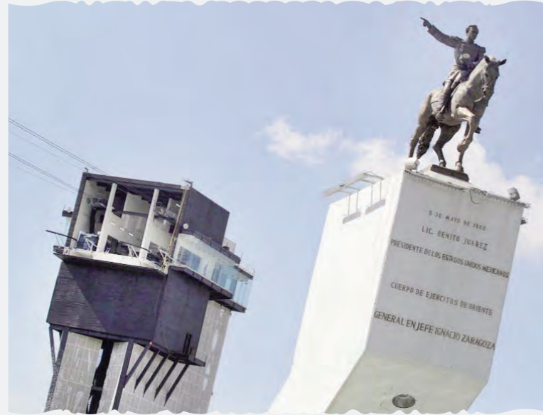
• Imagen tomada de http://oronoticias.mx/nota/162501/Inaugurara-Moreno-Valle-el-Teleferico-y-el-mural-mas-grande-del-mundo . Foto: Agencia Enfoque

El gobierno de Moreno Valle estaba dispuesto a transformar el cerro de Los Fuertes. No en vano su lema sexenal es el de "acciones que transforman". Después de echar a perder las ruinas de la iglesia del cerro de Guadalupe (las ruinas al parecer incomodan a los políticos) y de encerrar con rejas lo que es un parque natural,